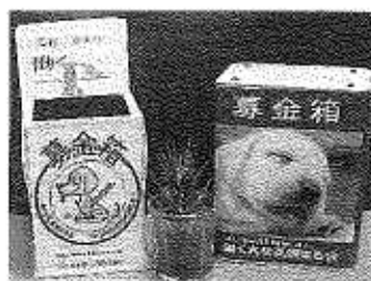
木製募金箱 オイル缶募金箱

店舗などのレジの近くに募金箱 を置かせてくださる方を募集し ています。 設置していただける方は、下記 ホームページ、又は ☎ 0463-54-4660 にてお申し込み下さい。