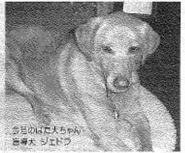
目のぼんちゃん 盲導犬 ジエドフ

発行：働く犬を支援する会 URL: http://www.hatainu.com/ TEL: 0463-54-4860 〒254-0082 神奈川県平塚市東豊田 594-32