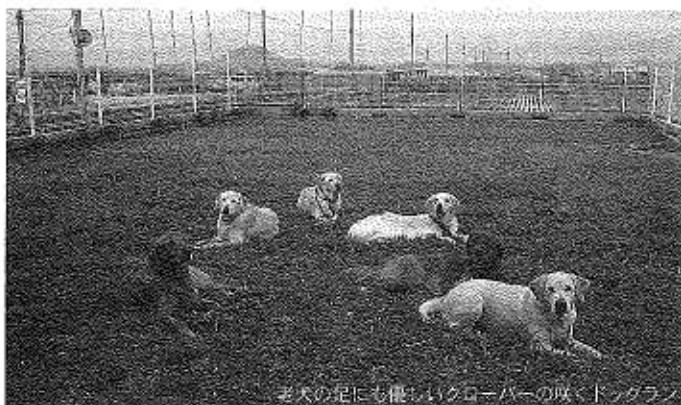
老犬の足にも優しいクローバーの取っドッグラン