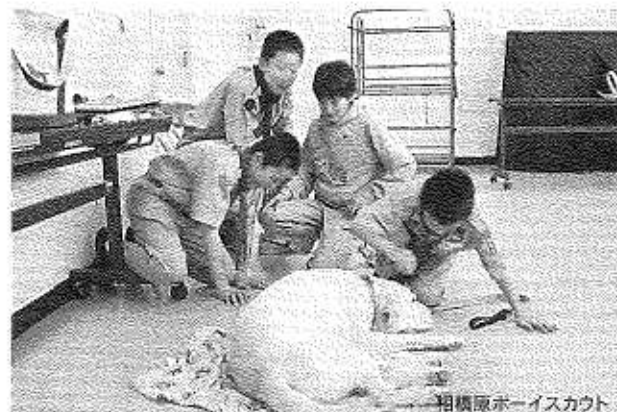
相模原ボーイスカウト

最近数々の中学校から「総合学習」の科目の中で「身体障害者補助犬法に定められている補助犬について学習したいので協力して欲しい」との要請が有り、はた犬では ユーザーさんとその言導犬をお願いして、それに退役犬とスタッフがチームを組んで学校を訪問しています。