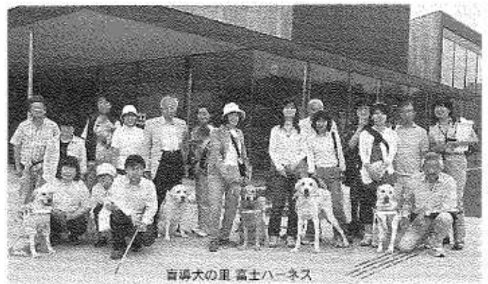
盲導犬の里 富士ハーネス

めに経過観察室が設けられていて、ここで引退犬は関係者たちから長年の務めをねぎらわれる中で看取られて永遠の眠りにつきます。見学のユーザーさんは説明を聞きながら思い思いに手を触れながら雰囲気にはたっていました。